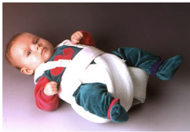
Spreizhose nach Graf

Die Spreizhose wird über dem Strampler getragen. Zu Beginn der Behandlung muss sie 24 Stunden am Tag getragen werden. Sie sollte lediglich zum Baden und Wickeln abgenommen werden. Es gibt verschiedene Arten von Spreizhosen mit diversen Vor- und Nachteilen - "strengere" und "weniger strenge". Verschiedene Typen von Spreizhosen werden von uns im Neugeborenenalter in Abhängigkeit vom Schweregrad der Erkrankung verwendet (s.u.). In der Regel reicht in den ersten Lebenswochen eine "weniger strenge", einfach anzulegende Spreizhose nach Mittelmeier aus.