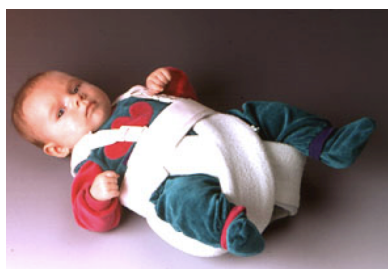
Spreizhose nach Graf

Es gibt verschiedene Spreizhosenmodelle. Alle werden über dem Strampler getragen. Zu Beginn der Behandlung muss sie 24 Stunden am Tag verwendet werden. Sie sollte lediglich zum Baden und Wickeln abgenommen werden. Verschiedene Typen von Spreizhosen sind im Neugeborenenalter gebräuchlich. Durch Unterlegen von zusammengefalteten Handtüchern oder anderen Polstern kann verhindert werden, dass der Oberkörper und der Kopf nach unten „hängt“. Das Kind kann mit Spreizhose auch auf die Seite gedreht werden, wenn man entsprechend unterpolstert.