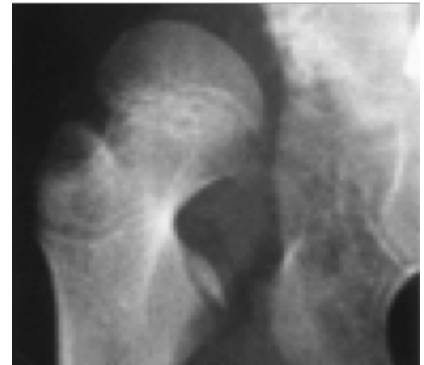
Hüftluxation im Röntgenbild (Alter 7 Jahre)

Bei der klinischen Untersuchung kann eine übernormale Beweglichkeit des Hüftgelenkes oder eine Abspreizhemmung auffallen. Auch Schnappphänomene sind zu beobachten. Eine Asymmetrie der Gesäßfalten kann ein Hinweis auf eine einseitige Hüftgelenksverrenkung sein. Da die Hautfalten beim Säugling allerdings fast nie symmetrisch sind, ist dieses Zeichen nicht sehr zuverlässig. Bei beidseitigem Befall bleibt die Untersuchung des Kindes oft unauffällig.