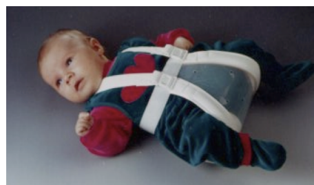
Spreizhose nach Mittelmeier